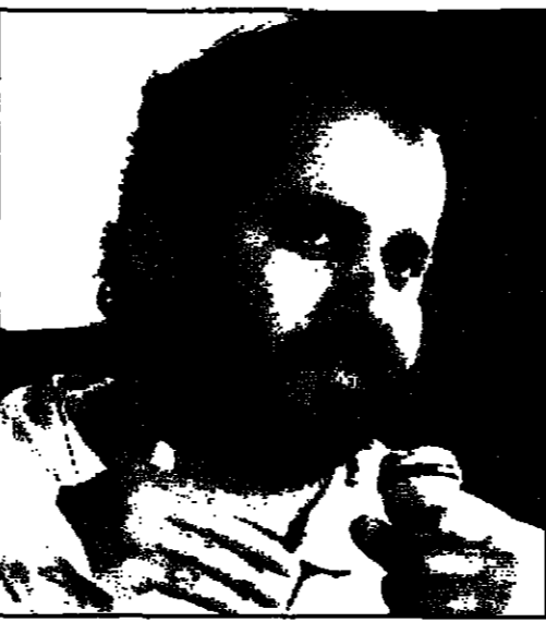
اسامة محمد (القدس العربي)

سيناريو واخراج: تيجل المالح، تمثيل: سمر سامي وبسام